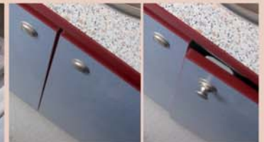
Möbelsystem Wasserfeste und quellfreie Möbelplatten mit versenkbarem Sicherheitsverschluss