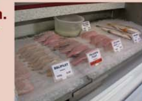
Verkaufs- Kühltheke Edelstahlauslage mit Kontakt- und Umluftkühlung