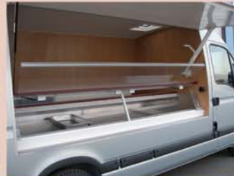
Verkaufstheke mit Hebeglasbeschlag Wichtig zum Bestücken und zur Reinigung