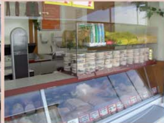
Front-Sicht Zusatzbord Winterschutzverglasung und Präsentationsregal in Einem