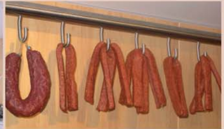
Hakenschiene aus Edelstahl Mit gebogenen Sicherheitshaken, speziell für den Fahrtbetrieb