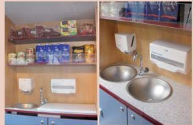
Hygienebereich / Handelswarenregal 2 Regale, Hygienebereich mit fließend Heißwasser