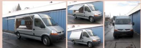
Kompakter und wendiger Aufbau Sekundenschnelle Öffnung der Vordachklappe mit leichtgängiger Innenbedienung

Der SM 290 Kastenwagen - attraktiv, praktisch und wendig zugleich. Geringe monatliche Kosten machen den rollenden Umsatzbringer zur lukrativen Investition für Ihr Geschäft !