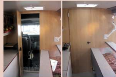
Durchgang mit Drehtüre zum Fahrerhaus Hoch, geräumig, sicher verschlossen