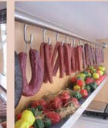
Hakenschiene aus Edelstahl Mit gebogenen Sicherheitshaken, speziell für den Fahrtbetrieb